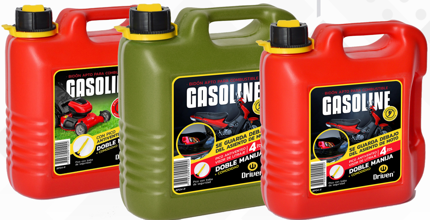
BE04R BIDON ROJO DE 4 LTS